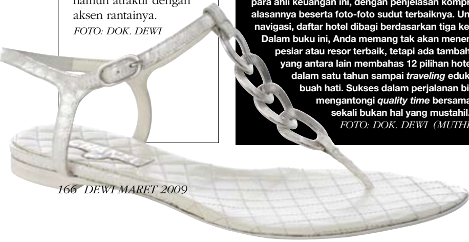
166 DEWI MARET 2009